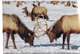
Rollen- und Rechte- management