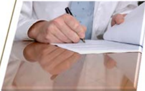
Betriebs- bzw. Dienstvereinbarung