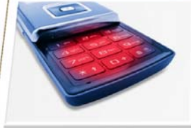
Regelung Erreichbarkeit und Verfügbarkeit